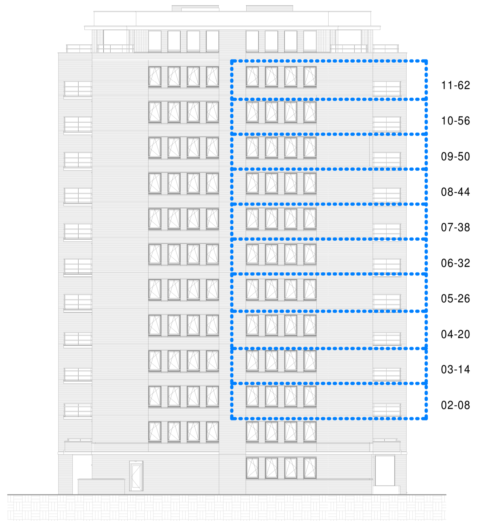
Oostgevel 1 : 200