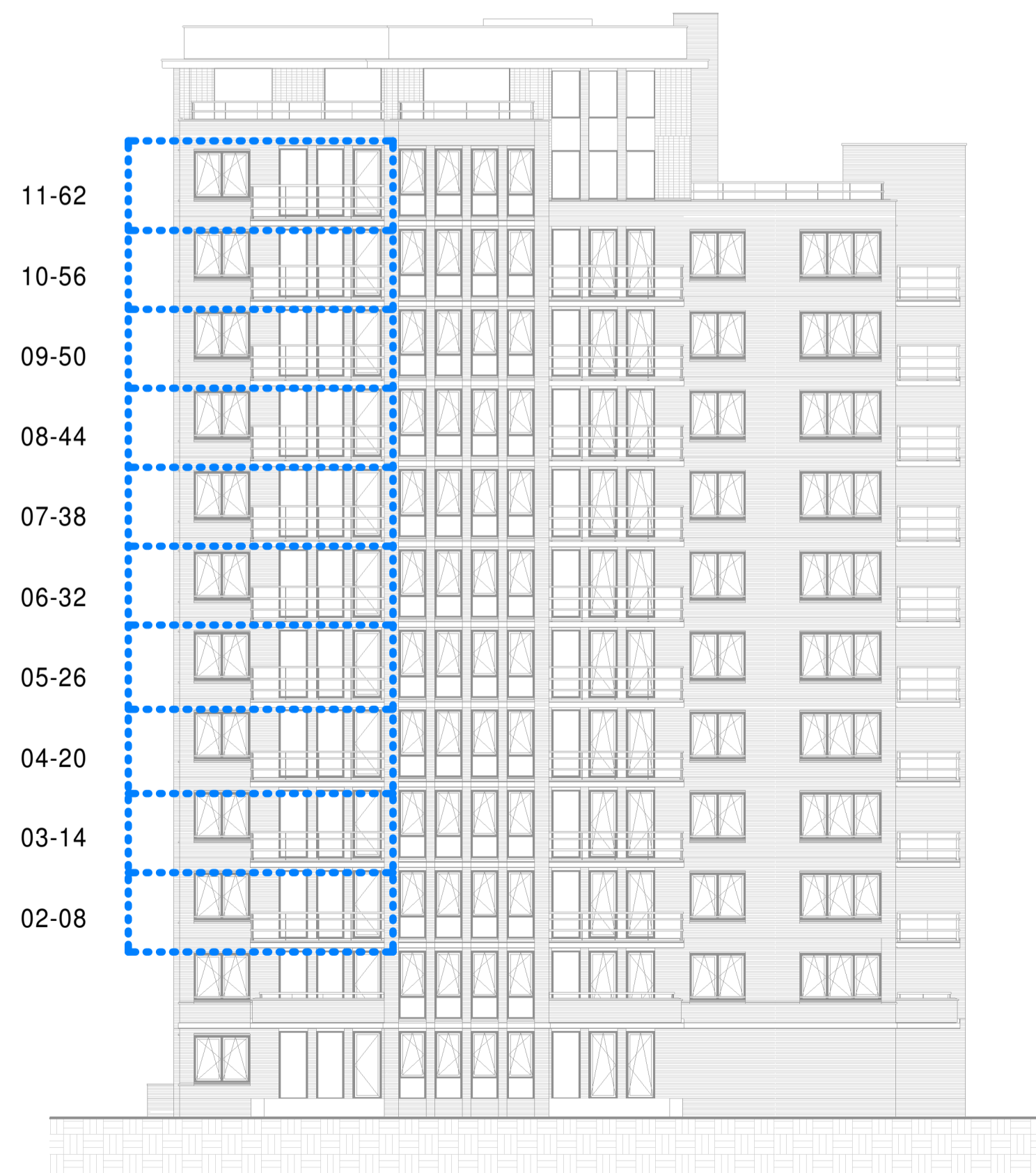
Noordgevel 1 : 200